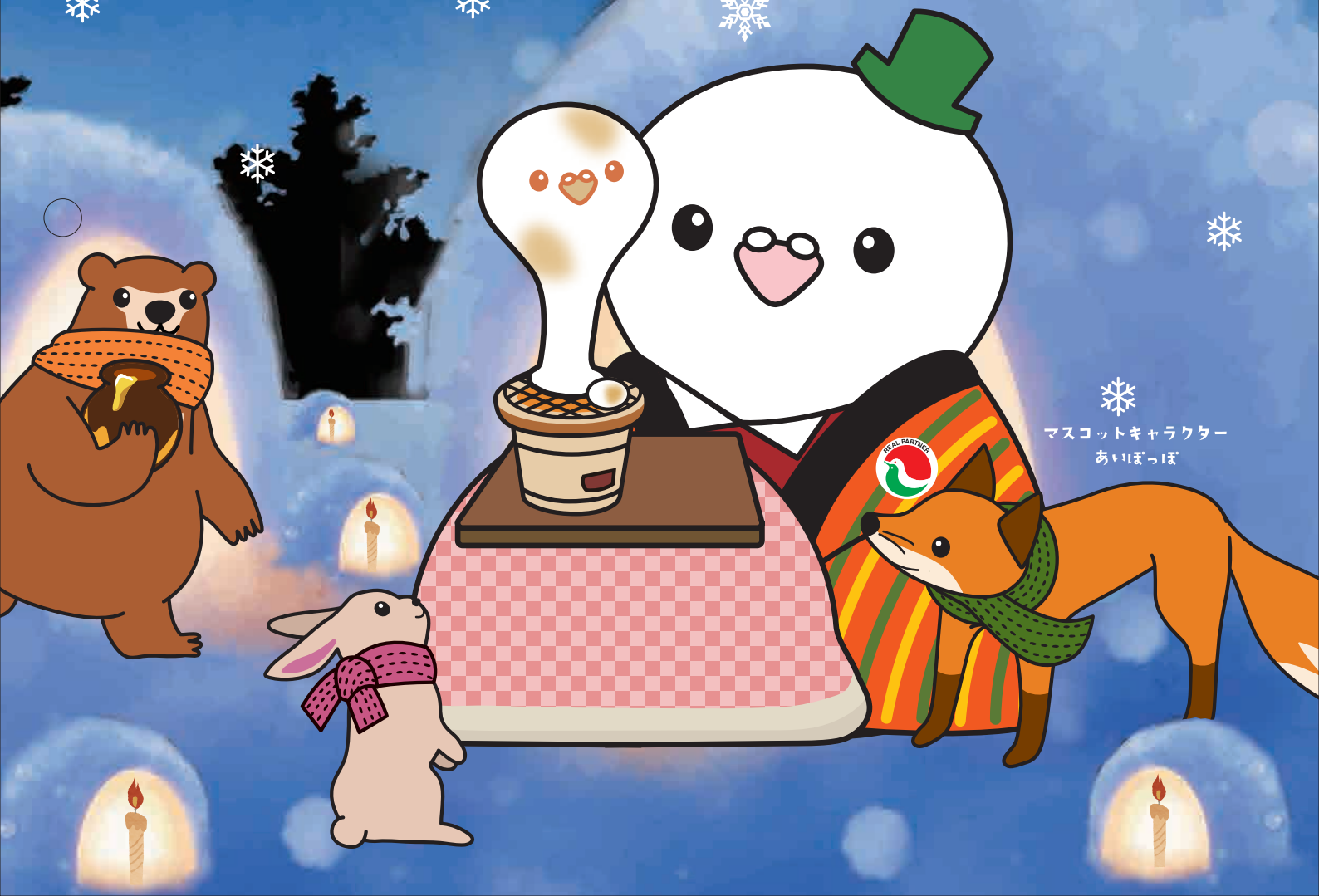
マスコットキャラクター あいまっぼ